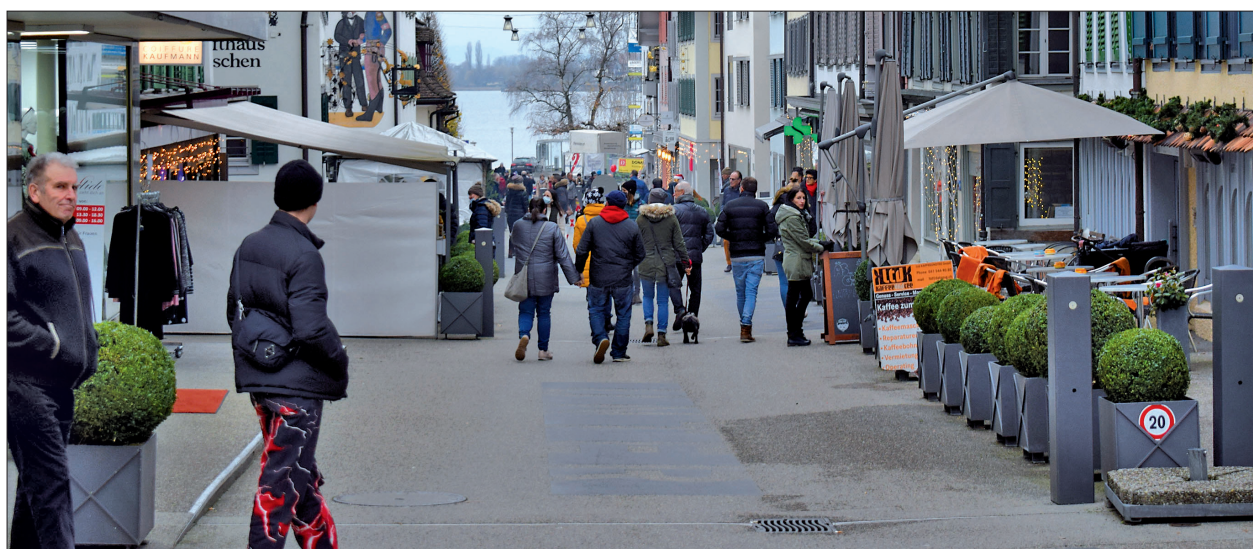
Trotz des kleineren Angebotes war am Sonntag doch einiges los im Dorf.