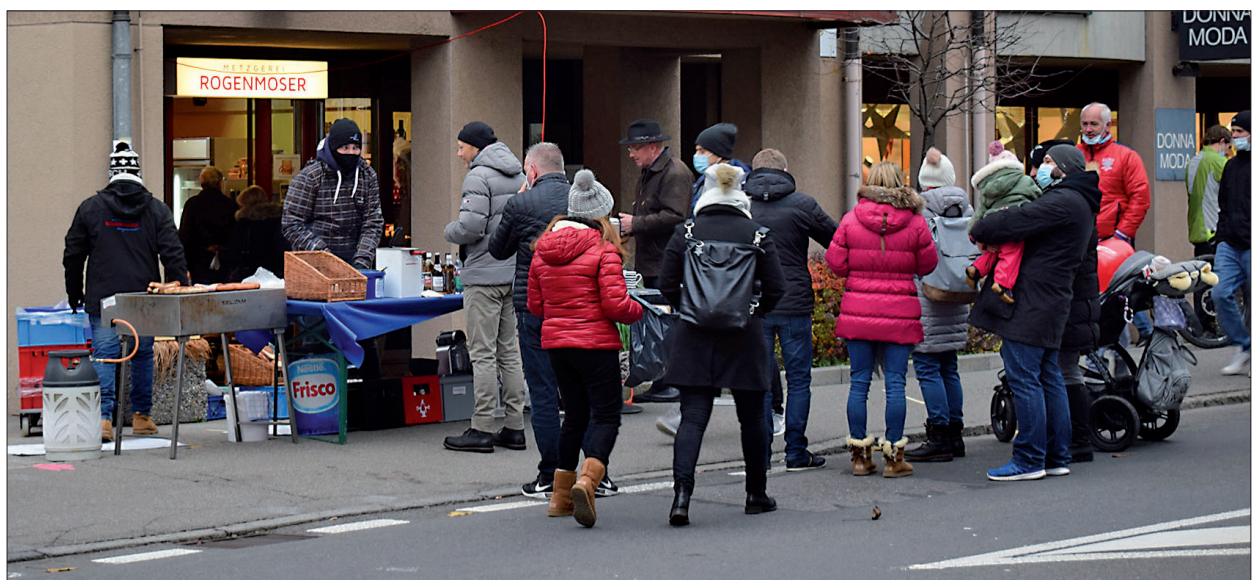
Der Wurststand der Metzgerei Rogenmoser kam gut an.